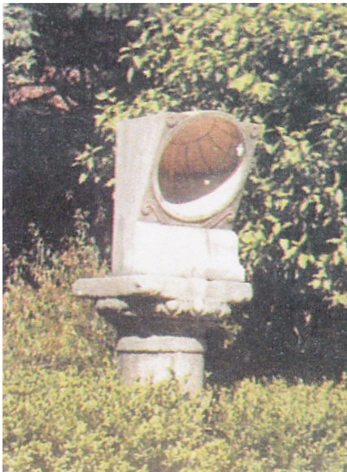
Слика 1: Аполонијев паук.

Којим редоследом су смештане статуе у нишама имало је посебну симболику. Два светлећа објекта као скулпторски приказ потпуна је новина у римској уметности (однос у диспозицији соларних биста детаљно је разрађен код W. Deonna (1946, стр. 131-132). Знамо да је Сол увек са десне, а Луна са леве стране у односу на централни елемент, у овом случају на низ скулптура у нишама. Сол има скулпторски приказ младића у хламиди, са атрибутом који држи у рукама (најчешће бич или глобус) или без тога. Луна је скулпторски рађена као девојка са високо опасаном туником и са обавезним атрибутом, а то је полумесец постављен у коси, на раменима или иза главе (Pliniae, 1969, стр. 103-104). Остале скулптуре су имале већ утврђену иконографију. Мали број научника се бавио овом проблематиком, тако да је могуће само спорадично долазити до извесних закључака.